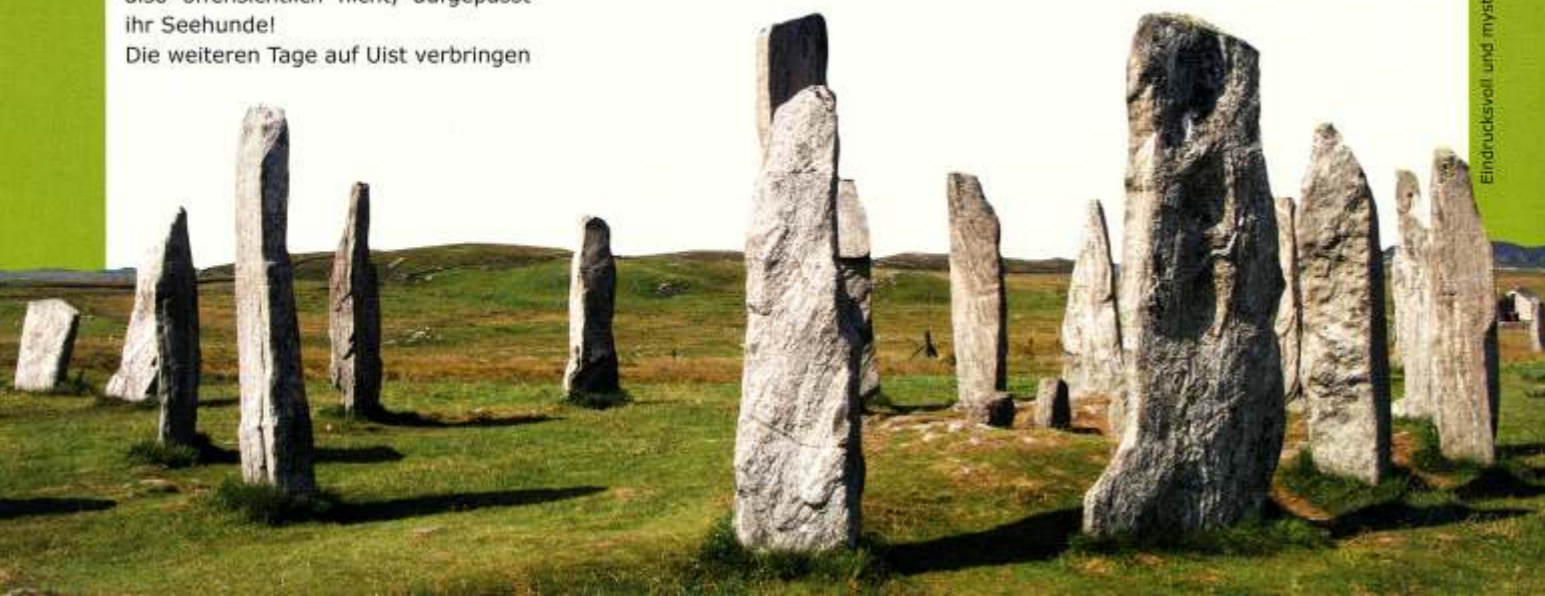
Eindrucksvoll und mysteriös: die Standing Stones von Calanais