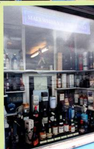
Whisky: kleiner Laden - aber big business