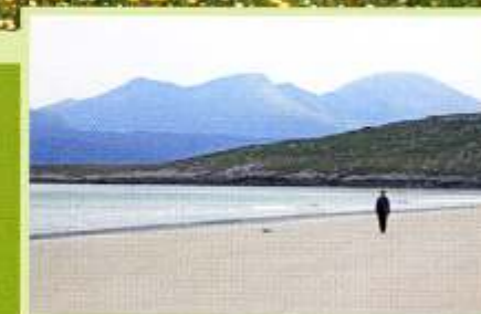
Die nächsten 40km nur weiße Strände