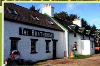
Der Ferryterminal der kleinen Insel Ulva

Du bist ein echter Allradler? Du hast ein Expeditionsmobil? Dann fahr endlich nach Schottland!