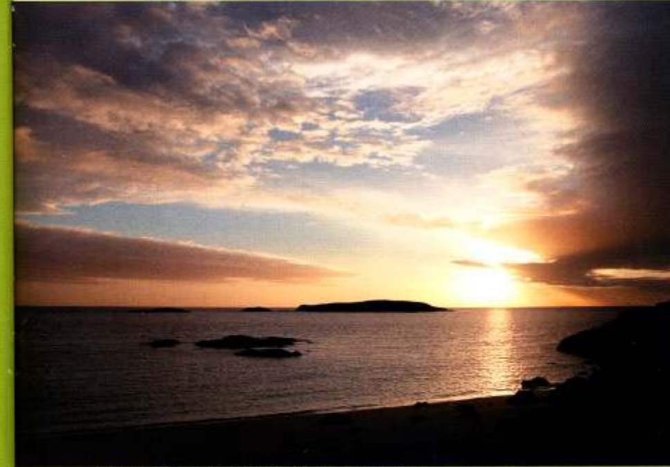
Immer wieder großartig: Lichtspiel beim Sonnenuntergang