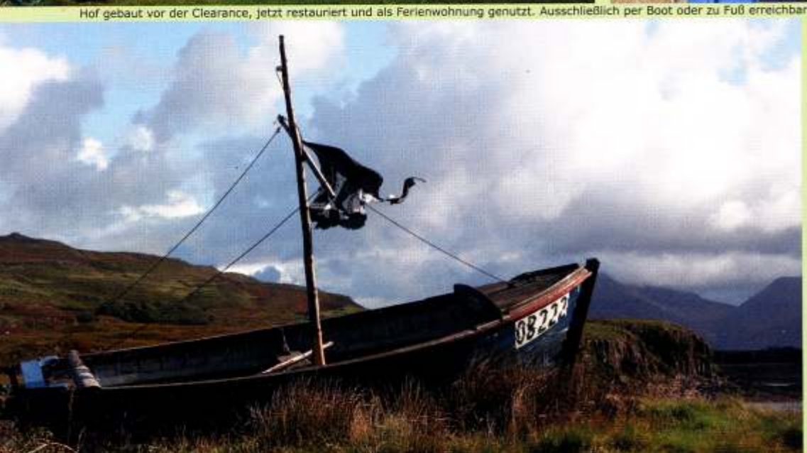
Auf den schottischen Inseln hat fast jeder ein Boot