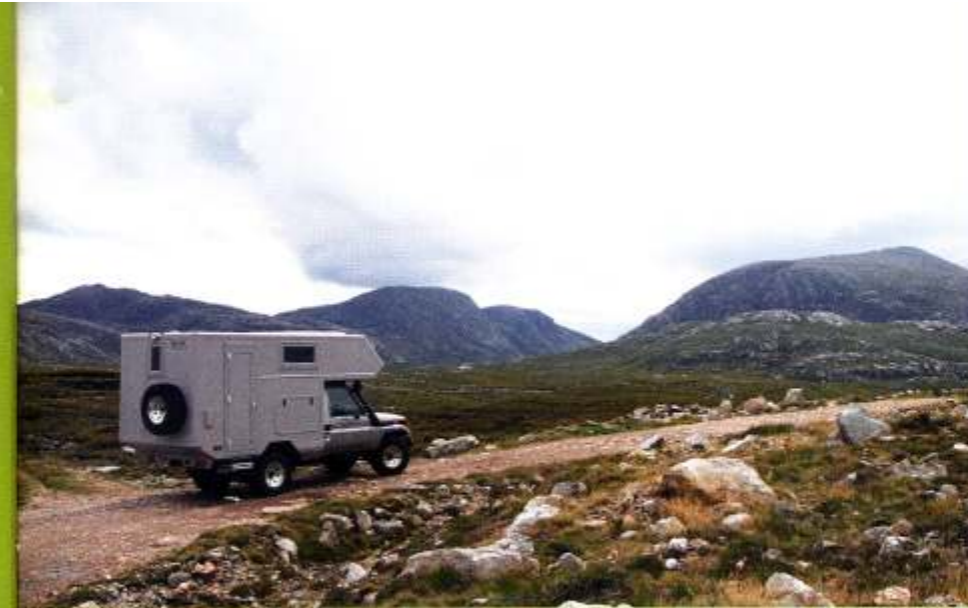
Piste in die karge Berglandschaft von West-Lewis

Die Aussicht ist traumhaft, die Ruhe und die Stille des Ortes berühren uns tief. Eigentlich hatten wir nur eine Übernachtung eingeplant. In Anbetracht dieser herrlichen Bucht bleiben wir aber länger und machen Wanderungen in die umliegenden Berge und zu den Stränden in der Gegend. Wie-