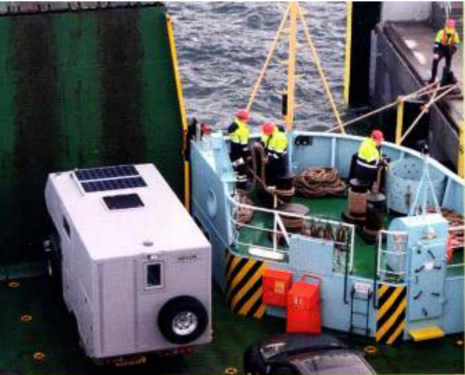
Auf der kleinen Caledonian MacBrayne Fähre in Oban