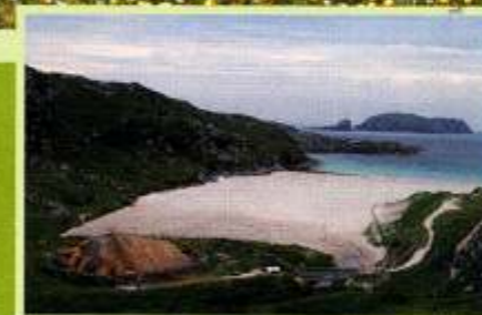
Prähistorische Siedlung an der Westküste von Lewis