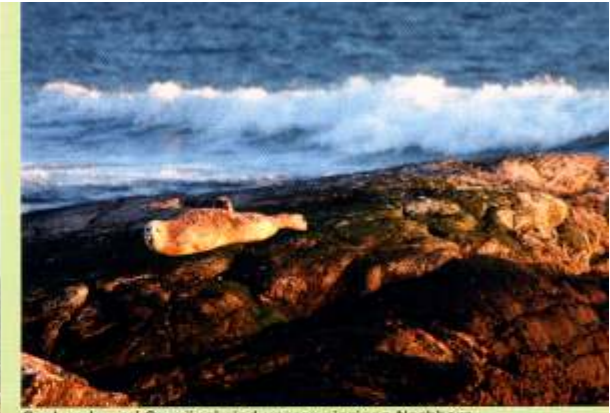
Seehunde und Seevögel sind unsere einzigen Nachbarn