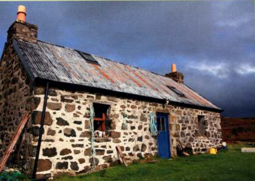
Hof gebaut vor der Clearance, jetzt restauriert und als Ferienwohnung genutzt. Ausschließlich per Boot oder zu Fuß erreichbar