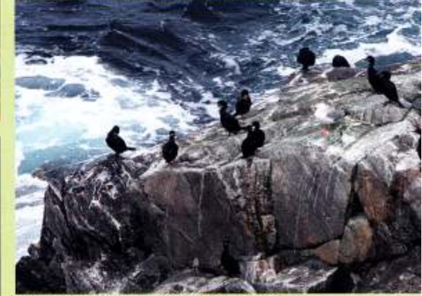
Damit kann ich mich stundenlang beschäftigen