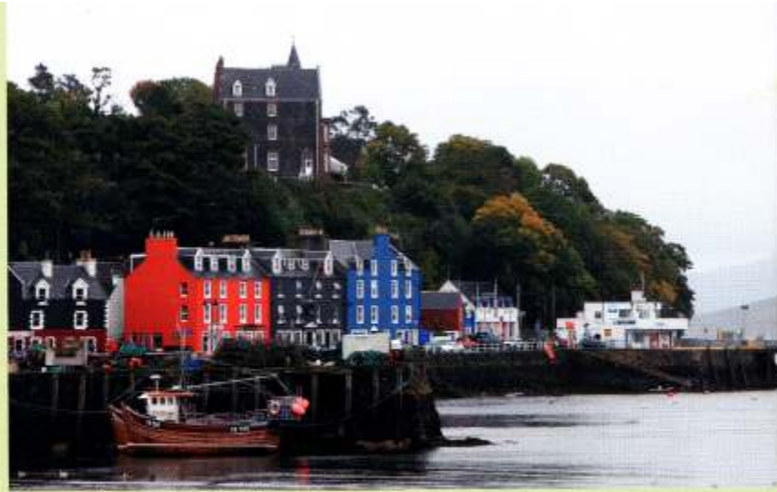
Tobermory, Hauptstadt der Insel Mull