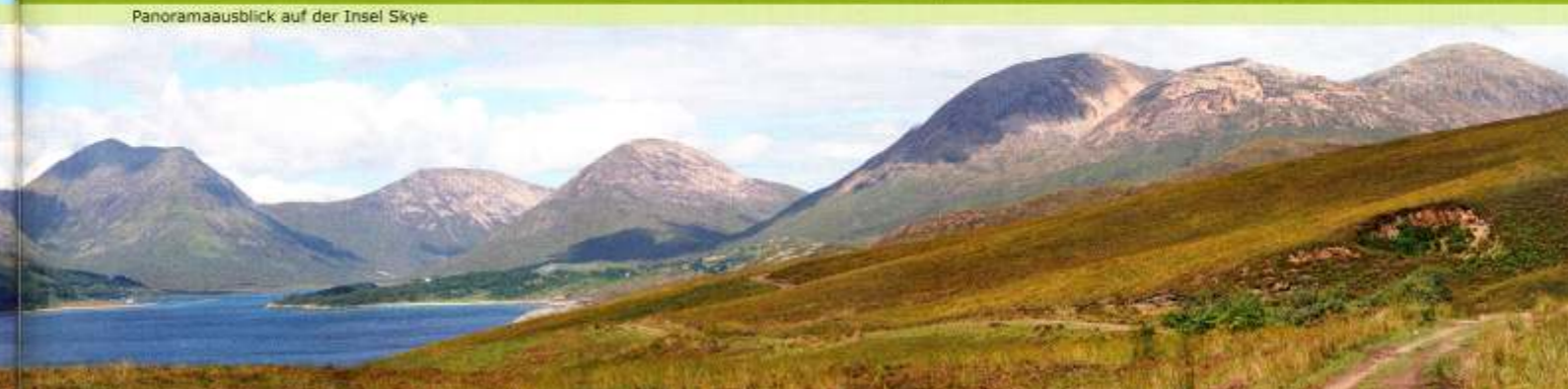
Panoramaausblick auf der Insel Skye